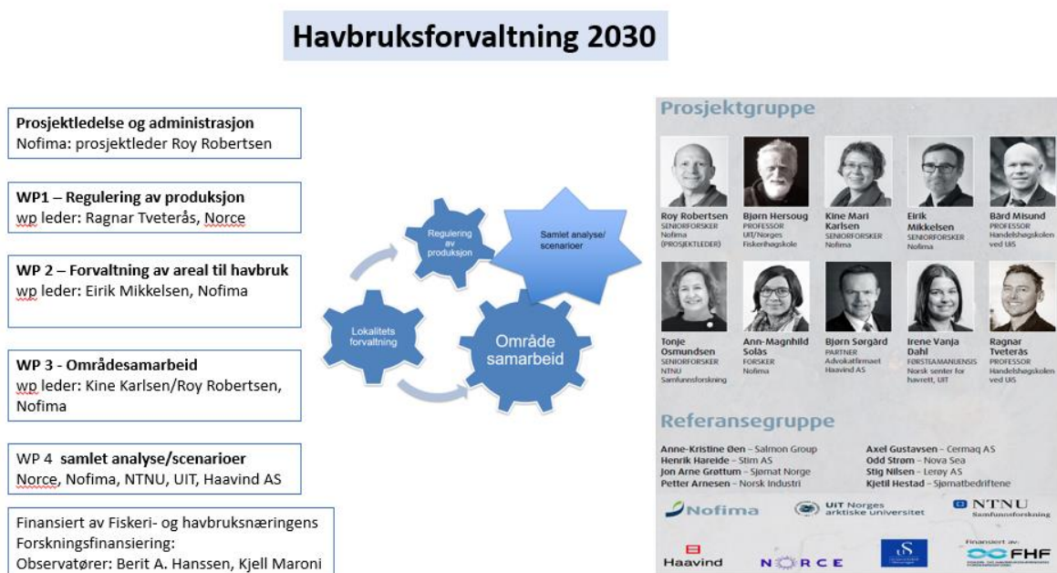
Figur 1 Prosjektorganisering og deltakere