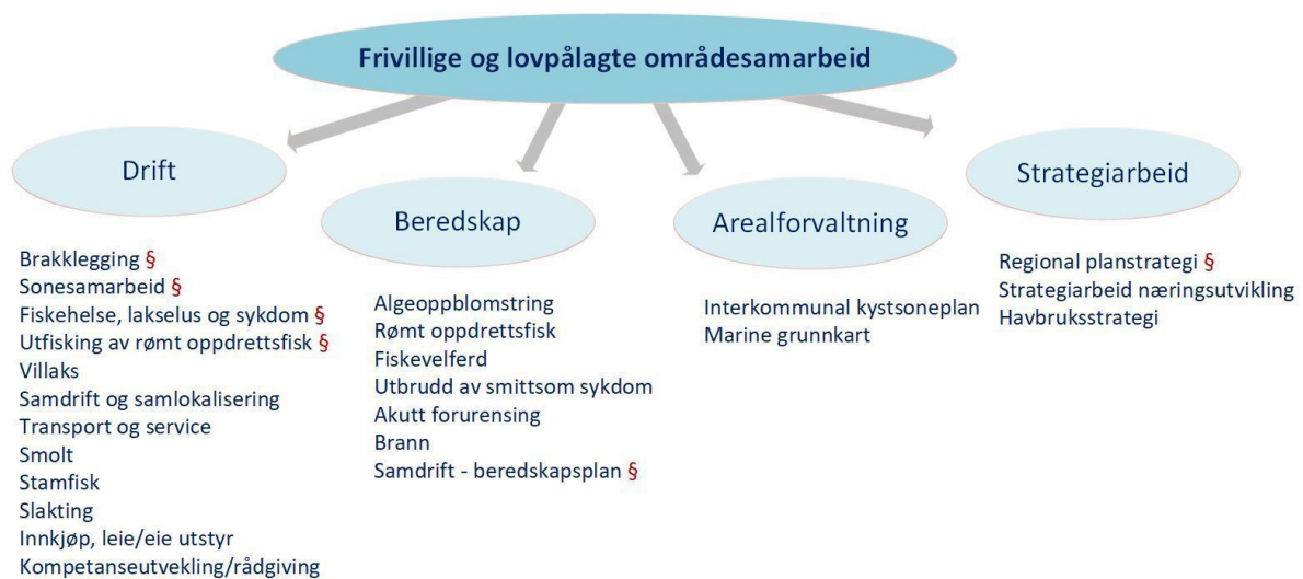
Figur 4 Identifisert samarbeid mellom aktører i havbruk, forvaltning og leverandører innenfor et geografisk område. § = Lovpålagt samarbeid

De fleste samarbeidene er frivillige, og mange oppdrettere har et mer utstrakt samarbeid enn det som kreves i loven. Verd å merke er at flere av informantene påpekte at samarbeidet på mange områder er "frivillig under tvang" altså de samarbeider frivillig for de vet at de risikerer å få pålegg fra myndighetene dersom de ikke samarbeider. En informant mente at: "det går mye fortere om næringen samarbeider frivillig uten at forvaltningen er koblet på". Ifølge en av informantene fra Mattilsynet har de oppfordret til mest mulig frivillig samarbeid, samordnet brakklegging og smitteforebyggende tiltak.