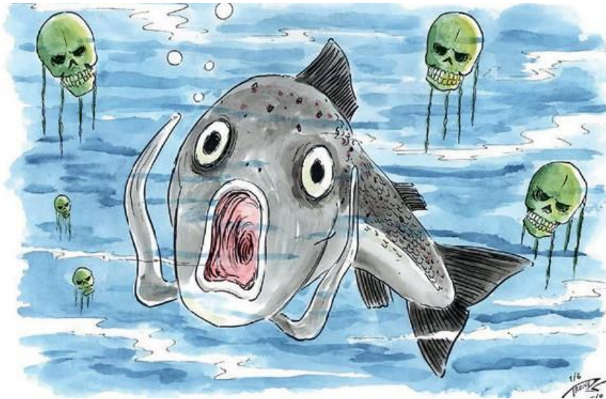
Figur 5 Algeangrepet – oppblomstringen av Crysochromulina leadbatteri satte samarbeid i krise på prøve

Studien viser at det er svært vanlig med samarbeid mellom oppdrettere i ulike geografiske områder. Og oppdretterne oppgir at det å samarbeide med andre er viktig på en rekke områder, men spesielt for daglig drift og beredskap. De viser til at samarbeid er spesielt viktig for å kunne redusere risikoen for sykdommer og negative eksternaliteter i et område. De ser også at samarbeid kan forbedre lønnsomheten i driften, men dette er et insentiv som anses som mindre viktig i vår undersøkelse.